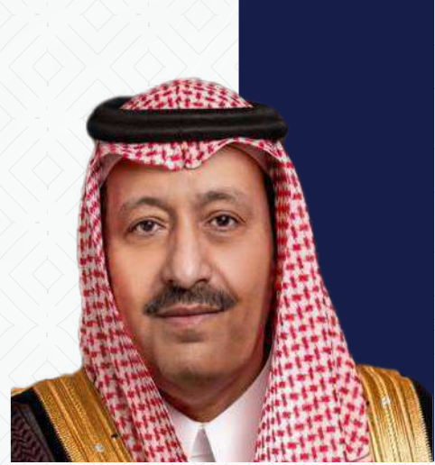
صاحب السمو الملكي الأمير الدكتور حسام بن سعود بن عبدالعزيز آل سعود أمير منطقة الباحة حفظه الله

أهداف رؤية ٢٠٣٠ تركز على تمكين القطاع غير الربحي والتوسع به ورفع مساهمته في الاقتصاد وفق منظور عالمي حديث ورؤية إستراتيجية حصرية