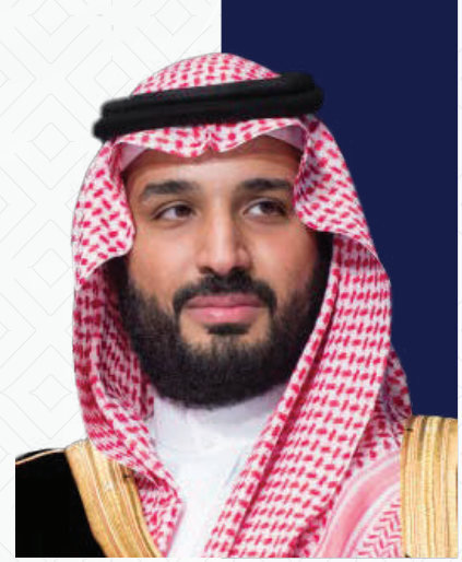
صاحب السمو الملكي الامير محمد بن سلمان بن عبد العزيز ال سعود ولى العهد رئيس مجلس الوزراء حفظه الله

القطاع غير الربحي منظومة الأنشطة الأهلية والخدمات التطوعية والمنظمات غير الحكومية التي لا تقصد الربح أساساً وتهدف إلى البر أو التكافل أو التعاون أو التنمية الاجتماعية أو غيرها من أغراض النفع العام.