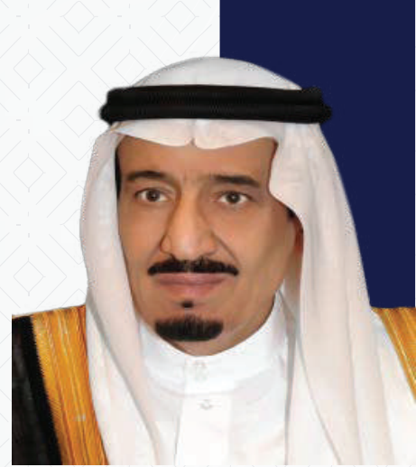
خادم الحرمين الشريفين الملك سلمان بن عبد العزيز آل سعود ملك المملكة العربية السعودية حفظه الله

القطاع غير الربحي هو المظلة الممتدة التي تفتح ذراعها للجميع، وهو الطاولة الواسعة التي يلتقي حولها القطاع الحكومي، و القطاع الخاص، وكذلك المجتمع بكافة أطيافه ومؤسساته وأفرادِه.